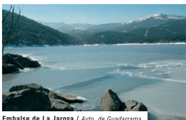
Embalse de La Jarosa / Ayto. de Guadarrama