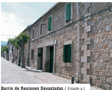
Barrio de Regiones Devastadas / Emade s.l.

A partir de los años 20, debido a la atracción de los madrileños por la Sierra, se construyeron las primeras colonias de veraneo, como La Alameda y Las Angustias en las zonas más alejadas del centro urbano modificando sustancialmente la tipología de construcción del pueblo.