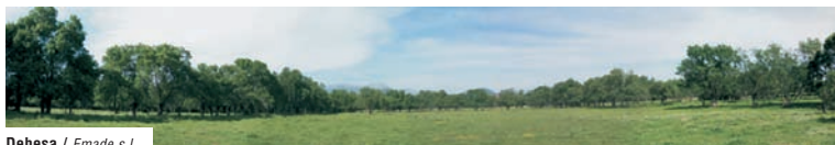
Dehesa / Emade s.l.

Durante el siglo XVI, bajo el reinado de los Reyes Católicos, la ganadería trashumante se vio muy favorecida, en detrimento de la agricultura y la ganadería estante. Con el paso de los años la trashumancia ha ido desapareciendo, dejando como huella en el municipio una extensa red de vías pecuarias por donde discurría tradicionalmente el tránsito ganadero y que hoy día se utilizan como itinerarios turísticos y ambientales.