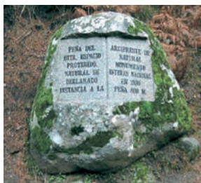
Peña del Arcipreste de Hita / Daniel Ferrer - Fernando Santa Cecilia

Guadarrama en la literatura - Guadarrama y su sierra han sido fuente de inspiración para grandes literatos, como prueban las múltiples referencias literarias existentes sobre este lugar.