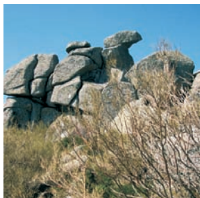
Peña del Arcipreste de Hita

También Góngora dedica un soneto a la Pasada de los condes de Lemos por el puerto de Guadarrama , al que llama montaña inaccesible .