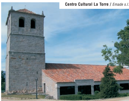
Centro Cultural La Torre / Emade s.l.

En las fiestas en honor de la Virgen de La Jarosa, el 15 de Agosto, se celebra la tradicional romería, llevando a la Virgen en andas hasta el embalse, donde se encuentra la ermita, construida en 1955.