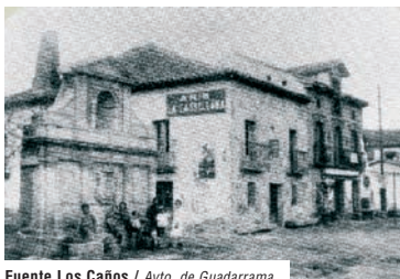
Fuente Los Caños

En 1924 se iniciaron las primeras captaciones de los manantiales del Monte Pinar, aprovechadas a su vez para generar la primera electricidad destinada al pueblo.