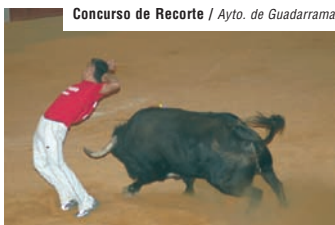
Concurso de Recorte / Ayto. de Guadarrama

Sin lugar a dudas, son las fiestas en honor de San Miguel Arcángel (3), el 29 de septiembre, y de San Francisco de Asís, el 4 de octubre, las principales celebraciones del pueblo. En ellas se organizan actividades de ocio, entre las que destacan afamados espectáculos taurinos: encierros, recortes y corridas.