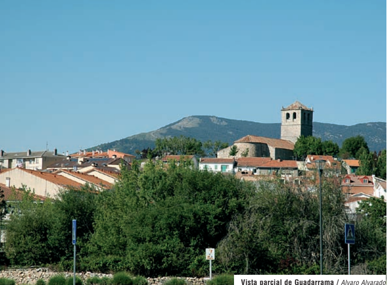
Vista parcial de Guadarrama / Alvaro Alvarado

G uadarrama goza de una estratégica ubicación, por lo que han sido numerosos los pueblos que se han asentado en sus tierras, proporcionando una historia rica y extensa a esta población. La vía romana que conectaba Titulcia, en el sur de Madrid, con Segovia, atravesaba su territorio, lo cual permitió el asentamiento de romanos, a los que sucedieron los musulmanes que denominaron estas tierras como Uad-Er-Ramel (río de arena), del que nace el actual nombre.