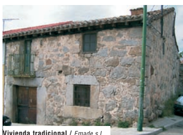
Vivienda tradicional / Emade s.l.

Viviendas singulares - Los oficios tradicionales condicionaron la arquitectura tradicional que presentaban las viviendas, construcciones típicamente rurales de mampostería granítica, habitualmente de dos alturas y cubiertas con teja árabe. A muchas de las viviendas se les añadían recintos agropecuarios, corrales y cuadras ya que muchos