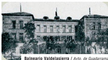
Balneario Valdelsierra

Salud - Entre finales del siglo XIX y principios del XX se desarrolló en Guadarrama una floreciente actividad económica basada en el cuidado de la salud, debido a la pureza del aire y a las propiedades curativas del agua. Se construyeron dos hotel-balnearios que utilizaban las aguas