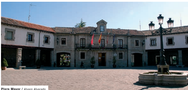
Plaza Mayor / Alvaro Alvarado

Hace décadas este lugar, conocido como "La Nava", era una zona de pastos muy cercana al municipio. Actualmente, es un parque utilizado como zona de esparcimiento, recreo y punto de encuentro de los vecinos.