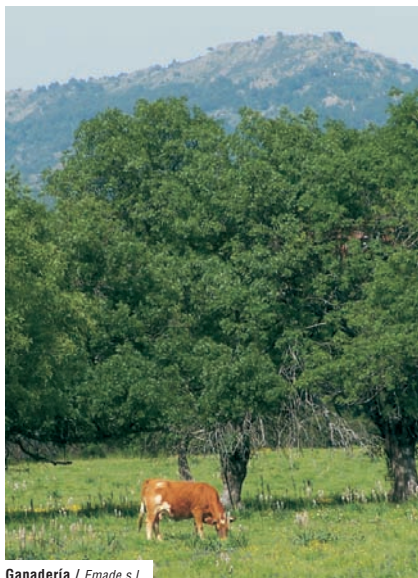
Ganadería / Emade s.l.

Las dehesas - Las dehesas de encinas y fresnos ocupan gran parte del término municipal. Estas dehesas históricamente han tenido una gran importancia, ya que eran aprovechadas por los pastores trashumantes. Así, en primavera los rebaños eran conducidos hacia las frescas montañas, en busca de sus densos pastos y la abundancia de agua, mientras que en invierno, cuando las condiciones climáticas empezaban a endurecerse en la sierra, bajaban a los cálidos llanos.